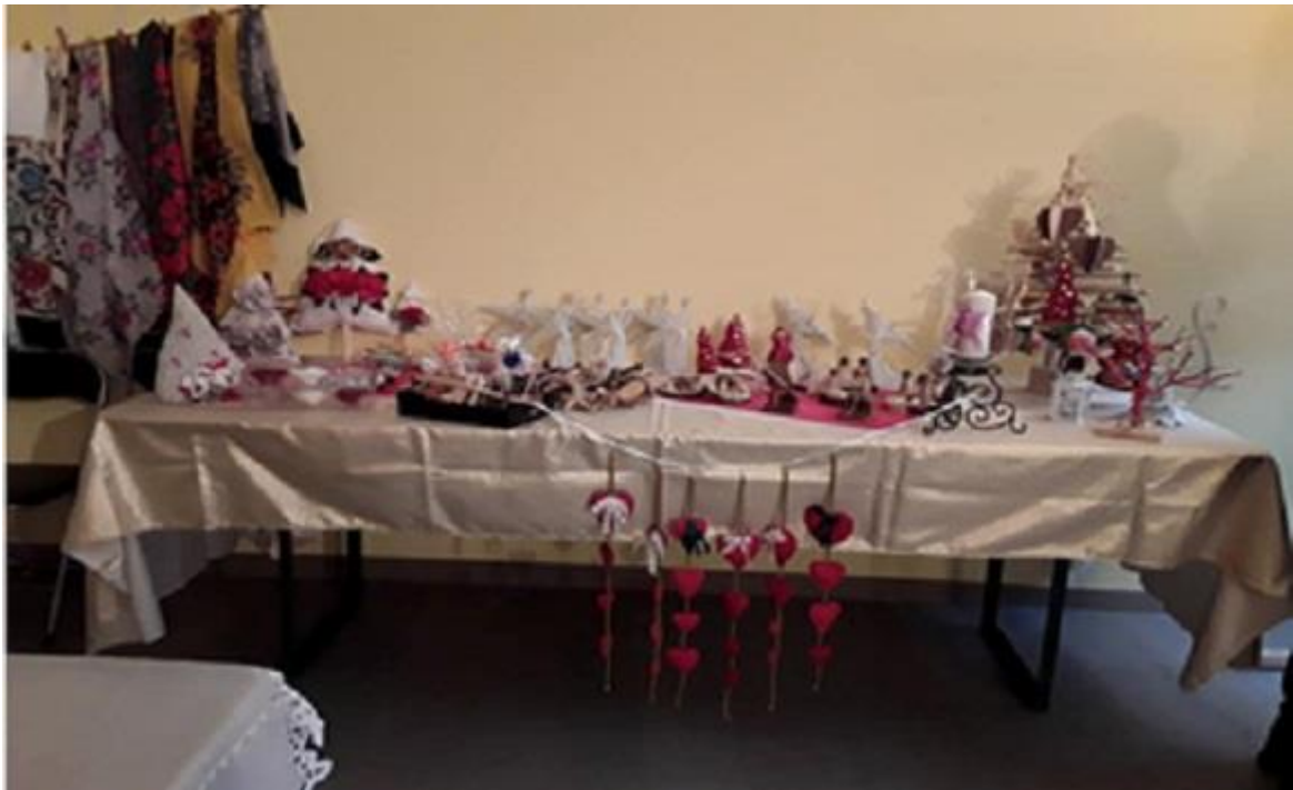
Mercatino di Treviglio