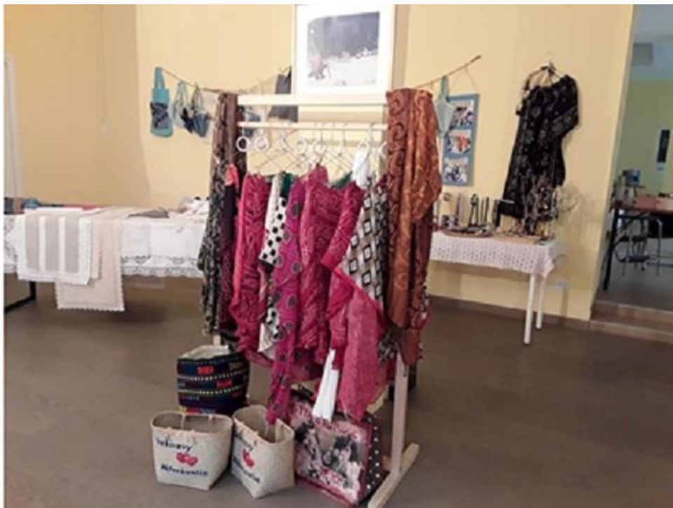
Subica (borse di paglia)e casacche pareo di Nosy Be