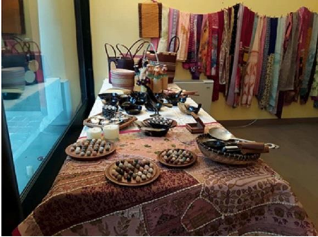
Sciarpe e borse dal Madagascar...