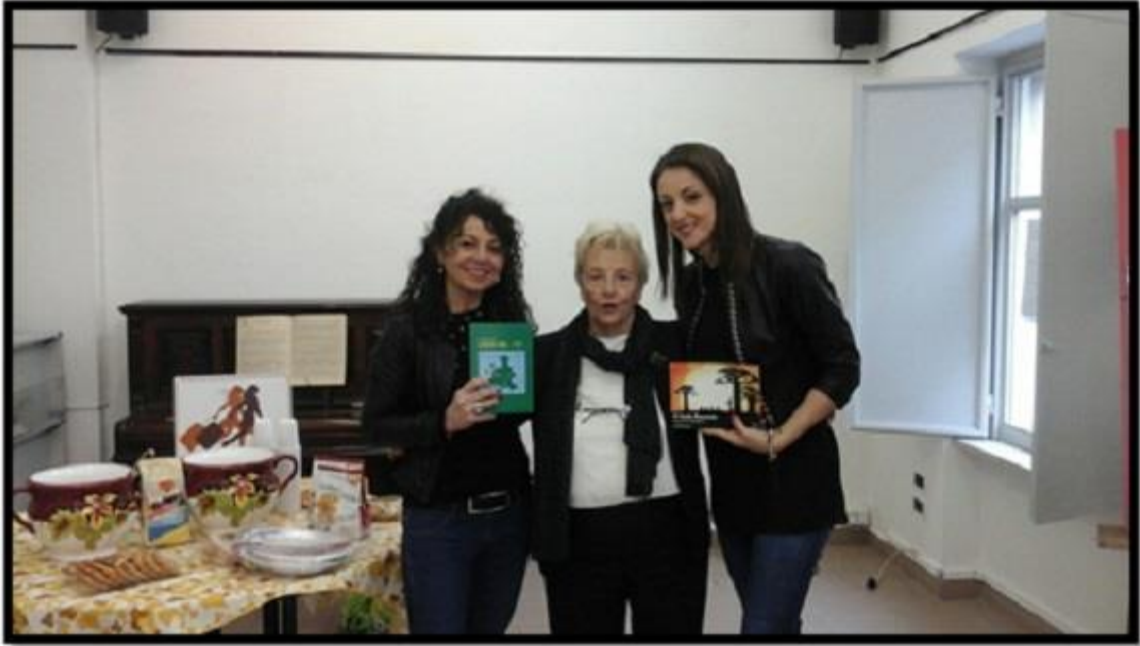
Incontro a Venaria Reale